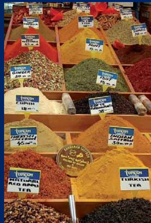
Marktkraam met kruiden en specerijen