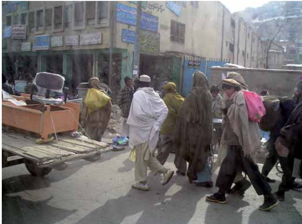
Straatscene in Kabul. Foto is gemaakt door de ruit van een auto.

Onze beveiligers nemen hun taak intussen serieus. Elke dag rijdt de auto via een andere route naar de ambassade, elke dag wordt op een ander tijdstip vertrokken. Er bestaat niet alleen het gebruikelijke risico van kidnapping zoals dat voor alle westerlingen geldt, maar er bestaat ook een zekere zorg door de achtergronden van de zaak. Dit onderzoek rijt veel oude wonden open. Het is goed denkbaar dat sommige Afghanen het niet erg op prijs stellen als bepaalde getuigen hun verhaal doen aan de Nederlandse delegatie.