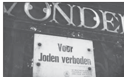
Het Vondelpark verboden voor Joden.

Duidelijk is dat de NIOD-onderzoeker voorlopig nog genoeg bronnen heeft om de waarheid over de advocatuur tijdens de Duitse