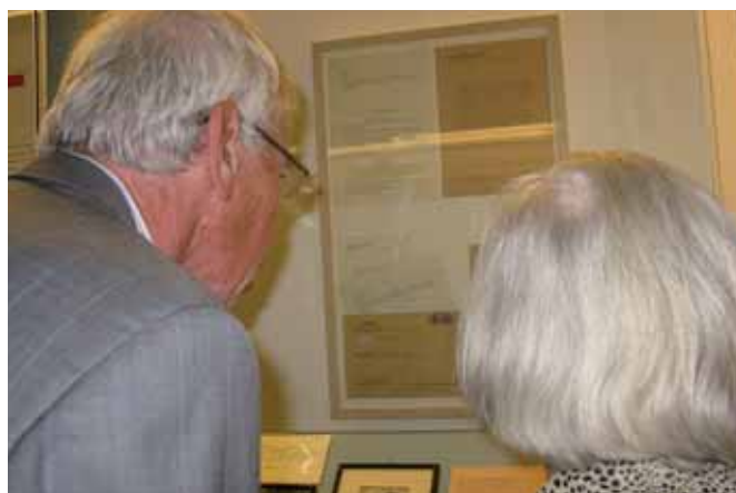
Nederlandse bijdrage aan de tentoonstelling.