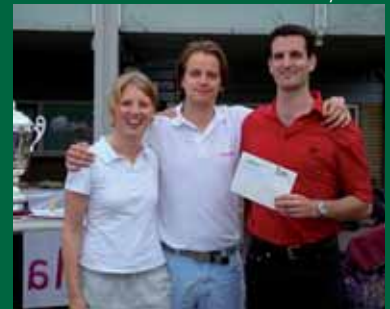
De derde prijs, een uur spelen op de banen van de Golf Republic, werd gewonnen door het team van Linklaters.