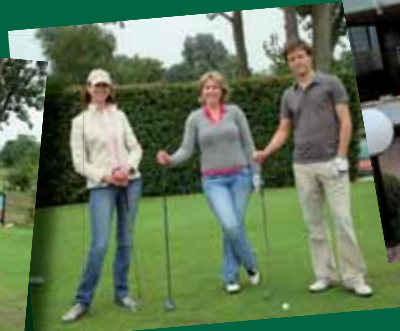
Nog enkele teamfoto's