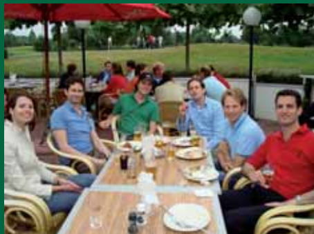
Tijdens de borrel