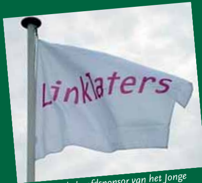
Linklaters, de hoofdsponsor van het Jonge Balie Golftoernooi

Dit toernooi werd mede mogelijk gemaakt door: Linklaters (hoofdsponsor), Brantjes Veerman, Stek, Houthoff Buruma, Stichting This is Golf, The Golf Republic en Jonge Balie Amsterdam.