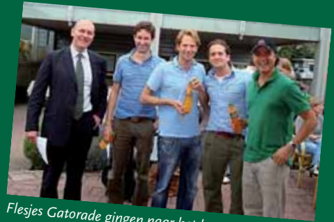
Flesjes Gatorade gingen naar het langzaamste team, tevens tweede prijs winnaars, Allen & Overy.