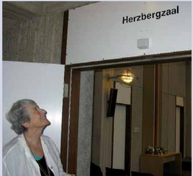
Dochter Judith Herzberg bij de nieuwe zaal