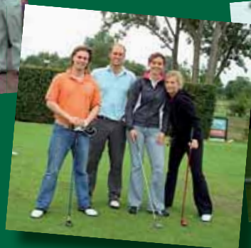
Team Brantjes Veerman