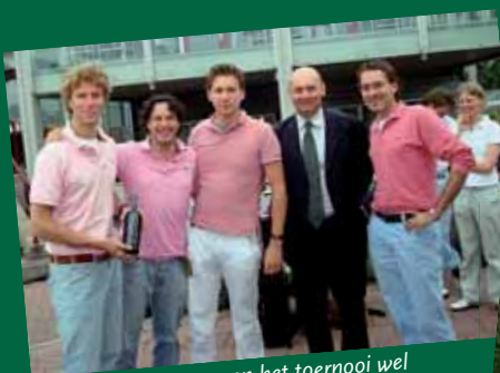
Sommige teams namen het toernooi wel erg serieus en kwamen in tenue... en werden daarvoor beloond met een fles port (vanwege de roze teint die ze hadden uitgekozen).