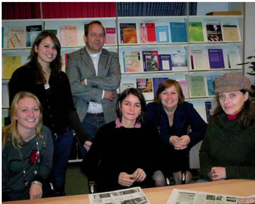
De medewerkers van de Praktizijnsbibliotheek.

Het gaat nog steeds volgens dezelfde afspraken, inmiddels verwoord in een Convenant. Om de zoveel tijd wordt de gang van zaken met de president van rechtbank en het bestuur besproken. De bibliotheek fungeert als centrale bibliotheek voor de rechtbank. De rechtbank heeft wel een gerechtsbibliotheek maar dat is in feite een verzameling van bibliotheekjes bij de verschillende secto-