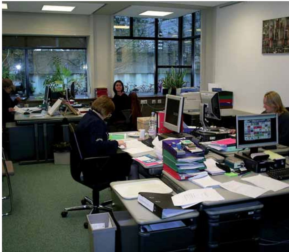
Het backoffice van de bibliotheek.

Ik ben eerst 17 jaar gerechtsbibliothecaris geweest bij de rechtbank in Haarlem. Ik had een bibliotheek opleiding gedaan en ben in 1982 begonnen. Vanaf 1984 studeerde ik communicatiewetenschappen, waar ik mijn interesse ben gaan ontwikkelen voor kwesties als: "hoe werken de professionals met informatie; de mensen die kennis moeten verwerken, hoe zit dat?" In 1990 ben ik afgestudeerd op dat onderwerp.