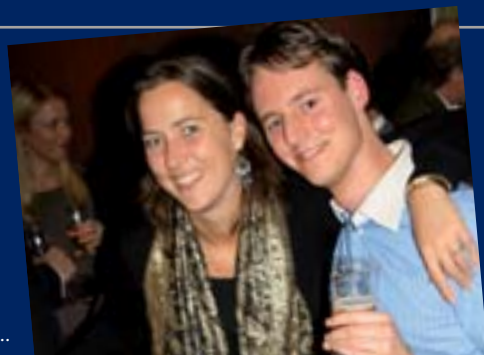
Vijf keer kansloos...