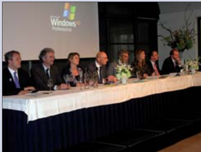
De Raad van Toezicht.

Hieronder volgt een selectie uit het Jaarverslag. Indien u het gehele Jaarverslag wilt lezen verwijs ik u naar www.advocatenorde-amsterdam.nl