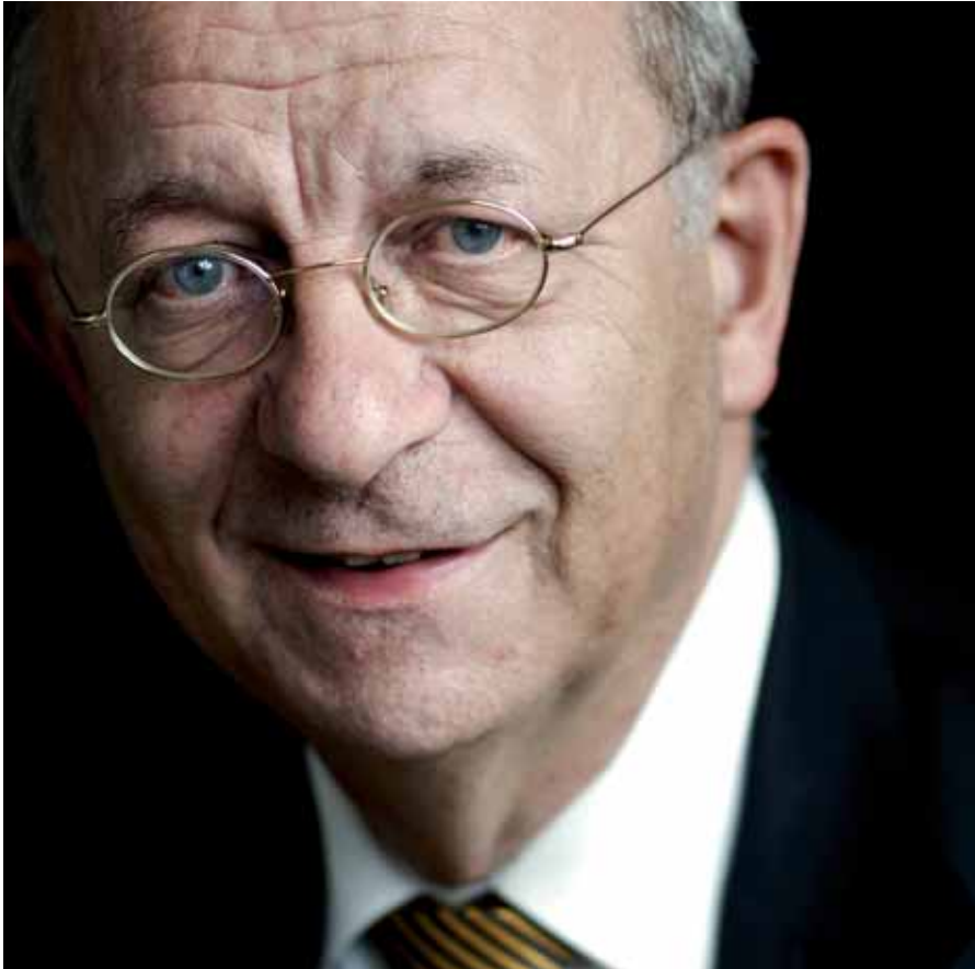
Bijdelijk: "De problemen waarmee corporaties nu te maken hebben en de prijsexplosie van woningen die ik voorzie, zullen door de Crisis- en herstelwet niet worden aangepakt."

De remedie is dat wij proberen om er via conservatief overleg en samenwerking uit te komen. Maar dan moeten er eerst nog een paar problemen worden opgeruimd. Dingen die emotioneel de discussie belemmeren. Ik noem om te beginnen de salarisdiscussie. Daar moeten we vanaf. Een tweede heikel punt is de integriteit van de sector. Die moet buiten kijf staan. Het moet onmogelijk zijn om je als verantwoordelijk directeur frauduleus te gedragen. Daar moet een radicaal eind aan komen. Dan hebben we in ieder geval twee emoties eruit. Daarna moet je een paar hele wijze mensen zien te charteren die het eigenbelang even terzijde schuiven en het volkshuisvestingsbelang centraal stellen.