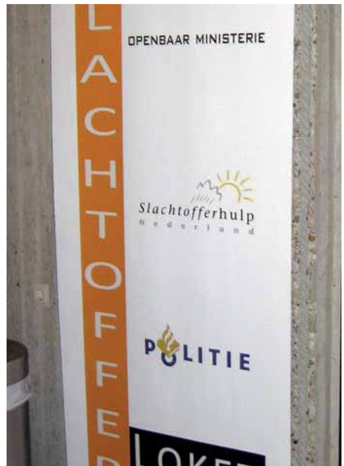
De frisse, nieuwe banner.

De officiële opening van het vernieuwde loket zal naar verwachting in april plaatsvinden. ■