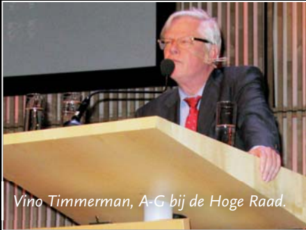
Vino Timmerman, A-G bij de Hoge Raad.