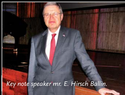
Key note speaker mr. E. Hirsch Ballin.