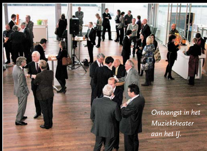
Ontvangst in het Muziektheater aan het IJ.