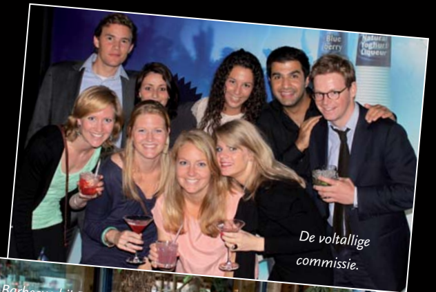
De voltallige commissie.