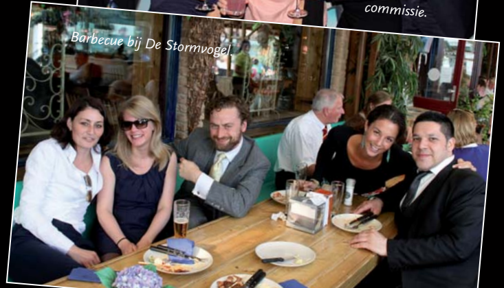
Barbecue bij De Stormvogel.