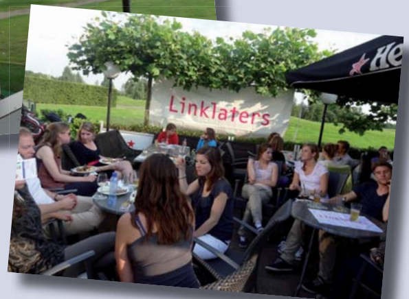
Borrel en barbecue.