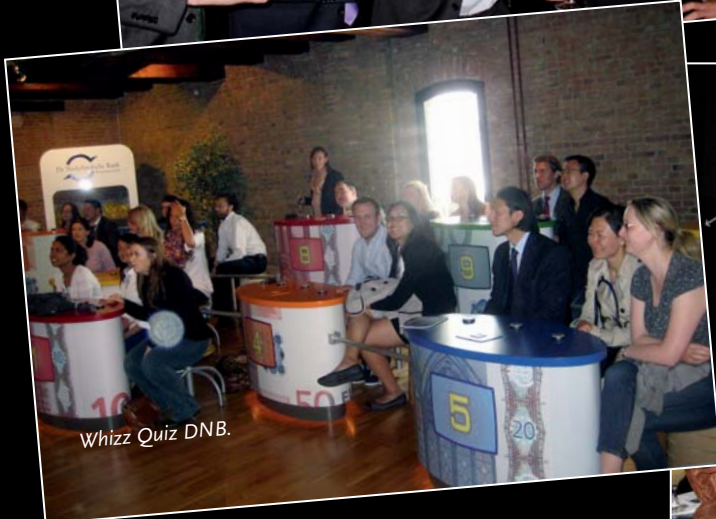
Whizz Quiz DNB.