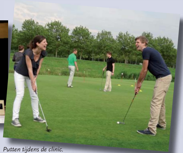
Putten tijdens de clinic.