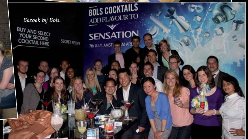
Bezoek bij Bols.

BUY AND SELECT YOUR SECOND COCKTAIL HERE