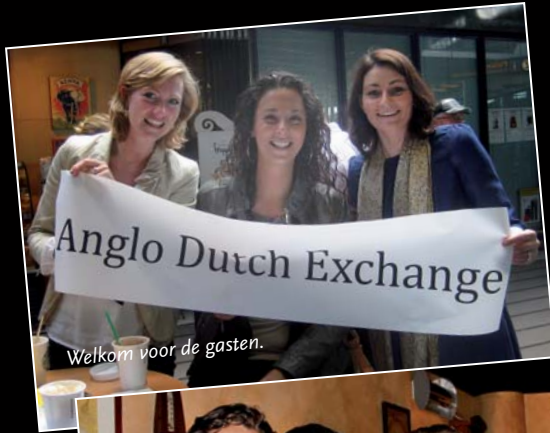
Welkom voor de gasten.