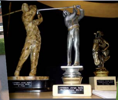
De felbegeerde bekers.